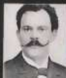
Silvije Strahimir Kranjčević