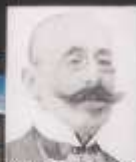
Xsaver Šandor Gjalski