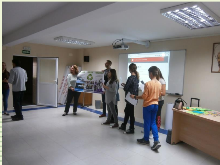
Prezentacija ekoloških tema