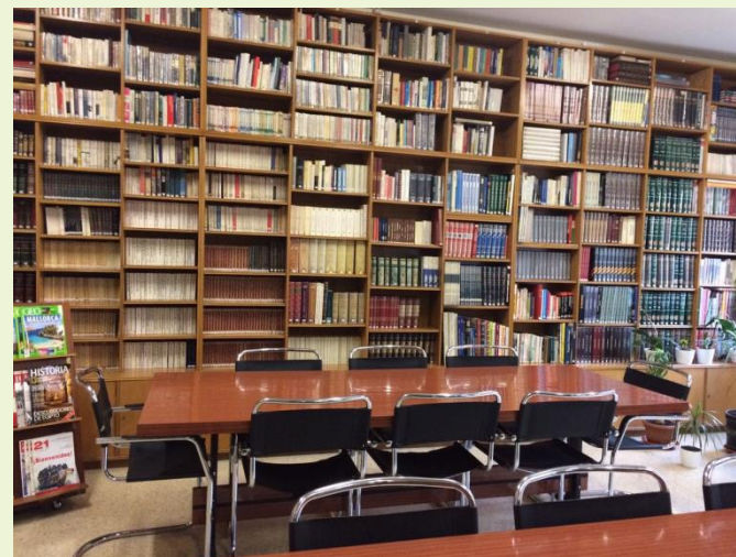
Školska knjižnica u Madridu